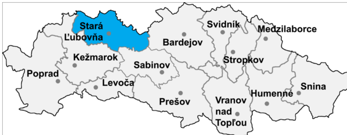
Umiestnenie okresu Stará Ľubovňa v rámci Prešovského kraja (zdroj: sk.wikipedia.org)

Cesty II. triedy: 20,787 km Cesty III. triedy: 138,639 km (zdroj: sk.wikipedia.org)