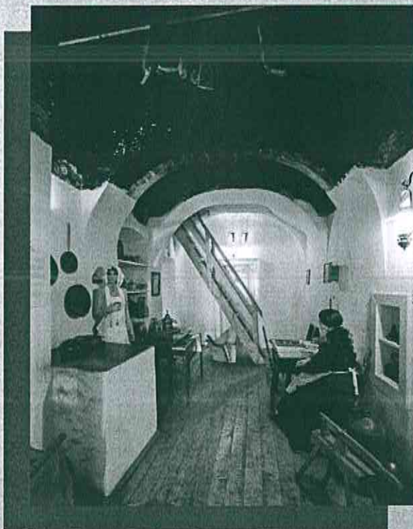
Expozície venovať významným Staroľubovníanom ale aj Kupecovi Kasperekovi