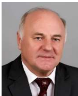
Volebný obvod: I. Politická strana, hnutie alebo koalícia: SOL