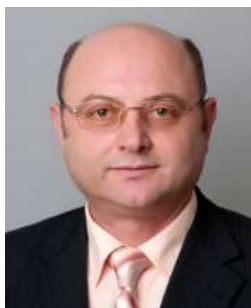
Volebný obvod: II. Politická strana, hnutie alebo koalícia: SMER