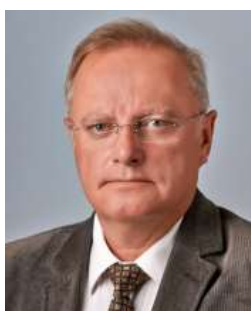
Volebný obvod: I. Politická strana, hnutie alebo koalícia: KDH, SDKÚ-SD, OBYČAJNÍ ĽUDIA a nezávislé osobnosti, NOVA