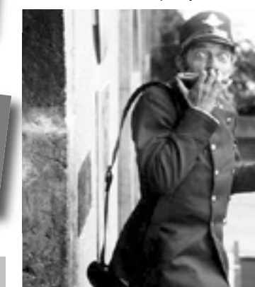
Pehavý Max a strašidlo

Tak, ako si zbieral staré maľované taniere, počas svojho života si zbieral aj peknú hrdku priateľov. Som rád, že som bol jedným z nich,