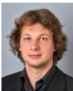
Volebný obvod: II. Politická strana, hnutie alebo koalícia: KDH, SDKÚ-SD, OBYČAJNÍ ĽUDIA a nezávislé osobnosti, NOVA