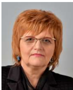
Volebný obvod: II. Politická strana, hnutie alebo koalícia: SMER