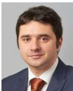
Volebný obvod: I. Politická strana, hnutie alebo koalícia: SMER